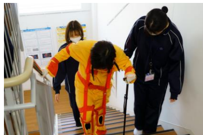
4月 なりきり研修(高齢者体験)