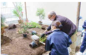
なりきり研修(美花隊体験)