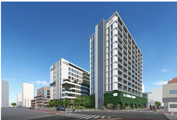
敷地北西（那の津通り）側から