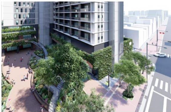
敷地北（那の津通り）側から