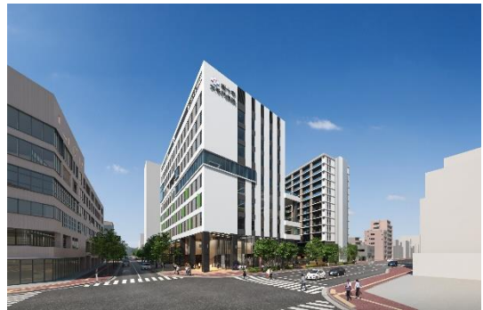
敷地北東（那の津通り）側から

桜十字大手門病院は、桜十字グループの医療法人愛光会が運営する慢性期・回復期病床 100 床の他、デイケア・外来機能を備えた病院です。病院内には、見晴らしが良く開放感のあるリハビリ空間を設けると同時に、中庭にもリハビリが可能な歩行空間を設ける等、幅広い世代がリハビリに専念できる様々な工夫を凝らしています。また、健康をテーマにしたイベントを開催するなど、予防医療への取組みにも力を入れています。