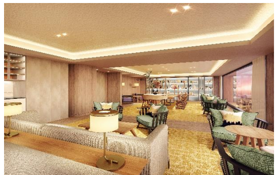
13 階スカイラウンジ

SJR 大手門は、JR九州シニアライフサポート株式会社が運営する自立の方向けの居室 168 室を備える有料老人ホームです。ダイニング・スカイラウンジ・大浴場等多彩な共用空間を備えます。大濠公園に近く、天神・博多までもアクセスが良い立地で、アクティブにお過ごしいただけます。また、全室に最新の IoT ヘルスケアサービスを導入しており、安心して暮らすことができます。