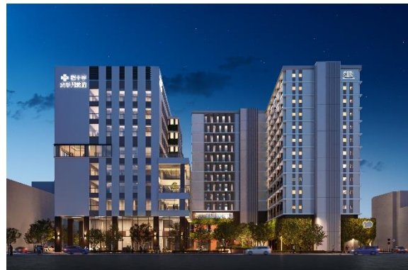
敷地北（那の津通り）側から（夜景）