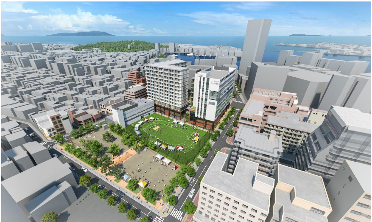
全体鳥瞰パース 敷地南（簗子公園）側から

簗子小学校は、地域におけるこれまでの地域活動や災害時の避難場所としての役割を担う場所でありました。本事業では事業方針を「地域を支える場所、再び。- Re すのこ -」とし、地域の賑わいや魅力づくり、災害対策、安全安心の拠点とすべく、病院、高齢者施設、芝生広場、体育館等からなる開発を進めてまいります。