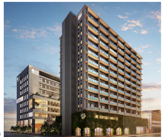
外観(那の津通り側)

SJR ザ・クラス大手門は、JR九州シニアライフサポート株式会社が運営する自立の方向けの居室168室を備える有料老人ホームです。スカイラウンジ・ダイニング・大浴場等多彩な共用空間を備えます。大濠公園に近く、天神・博多までもアクセスが良い立地で、アクティブにお過ごしいただけます。また、全室に最新のIoTヘルスケアサービスを導入しており、安心して暮らすことができます。