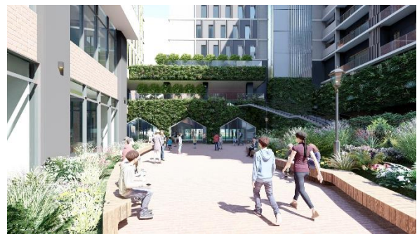
豊かな緑や花で潤いのある中庭