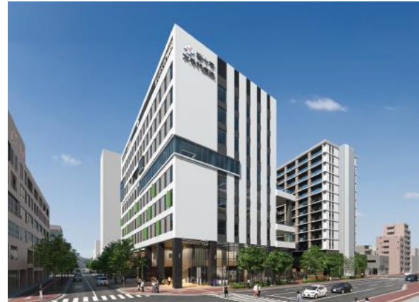
外観(那の津通り側)

桜十字大手門病院は、桜十字グループの医療法人西福岡桜十字が運営する回復期病床・慢性期100床の他、デイケア、外来機能を備えた病院です。病院内には、広々としたリハビリテーションセンターがあり、一人ひとりにあたりハビリに専念いただけます。また見晴らしが良く開放感のある屋上庭園や中庭の散歩コースなど、気持ちの良い屋外でのリハビリにもチャレンジしたくなる環境も整えています。隣接する「SJR ザ・クラス大手門」とは2階で繋がっており、入居者さまが外に出ることなく外来を受診いただけます。