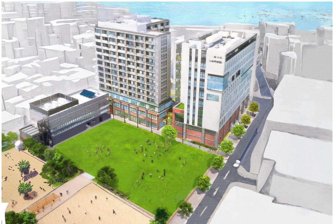
全体鳥観図 敷地南(箕子公園)側から

「地域を支える場所、再び。- Re すのこ -」というコンセプトのもと、地域の賑わいや災害にも強い安全安心の拠点となる新しいまちづくりを行い、人と緑が繋がる潤いのある空間として、街の新たな価値を創出します。