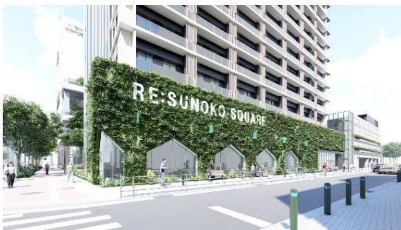
西側の壁面緑化(大手門商店街)

設計の段階から豊富な植栽計画を取り込むことで、敷地全体の緑化率 44%超 を確保。福岡市が進める「都心の森1万本プロジェクト」 ※4 や「一人一花運動」 ※5 と連動し、都心部でありながら美しく潤いと安らぎのある、花や緑豊かな環境を実現しました。ヒートアイランド現象の緩和等にもつながります。