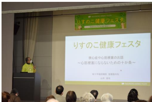
すのこ体育館で健康フェスタを開催 (令和5年2月)