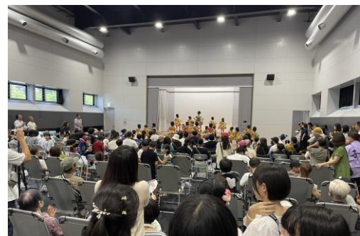
すのこ体育館で夏まつりを開催 (令和5年8月)