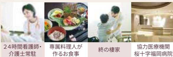
24時間看護師・介護士常駐

わが家のように、自由にのびのびと暮らしていただけるよう、サービスも充実させています。