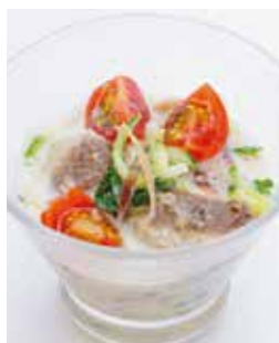
旬の夏野菜でビタミンと、牛乳でカルシウムも補給！