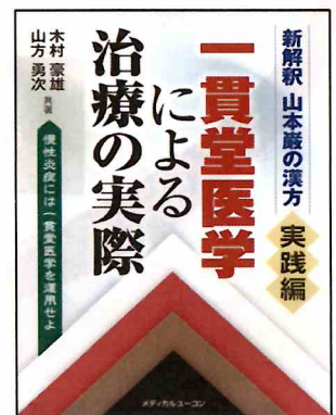
山本巖の漢方＜実践編＞ 一貫堂医学による治療の実際