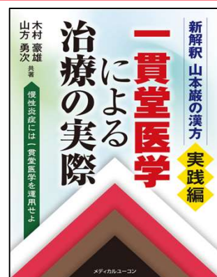
山本巖の漢方＜実践編＞ 一貫堂医学による治療の実際